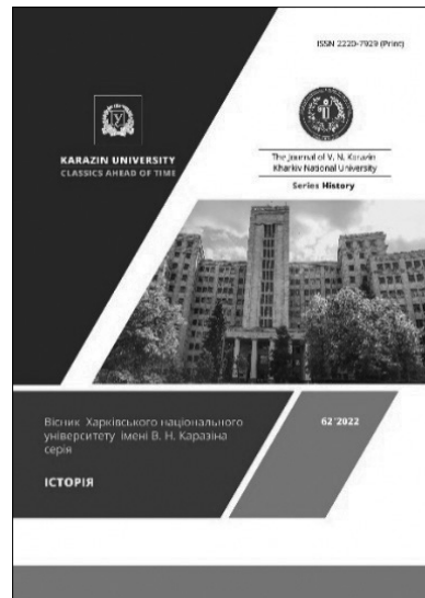
Спеціальний випуск «Вісника Харківського національного університету імені В. Н. Каразіна. Серія «Історія»» (вип. 62, 2022 р.), підготовлений командою проєкту «МІСТО І ВІЙНА»

З метою оприлюднення окремих результатів досліджень учасниць та учасників проєкту «МІСТО І ВІЙНА», було підготовлено спеціальний випуск фахового журналу «Вісник Харківського національного університету імені В.Н.Каразіна. Серія «Історія»» (вип. 62, 2022 р.). Він містить дослідження актуальних питань, пов'язаних зі знищенням та збереженням різноманітної міської культурної спадщини під час російсько-української війни, сучасною медійною репрезентацією українських міст та їхньої культурної спадщини, специфікою діяльності музеїв, архівів і бібліотек під час війни, актуальними викликами, що постали перед освітньою галуззю та культурно-мистецьким життям українських міст у період російської військової агресії 16 .