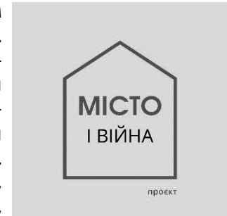
Лого проєкту «МІСТО І ВІЙНА»

Також слід відзначити, що російсько-українська війна стала тригером для переосмислення в українському суспільстві змісту та значення культурної спадщини, спричинила певний «поворот» у розумінні та ставленні до культури загалом. З одного боку, спостерігається посилення суспільного інтересу до традиційних культурних зразків, які розглядаються як основи української національної ідентичності. Показовим прикладом слугує посилення суспільного інтересу до нематеріальної культурної спадщини України (сьогодні до Національного переліку елементів нематеріальної культурної спадщини України належить 77 елементів нематеріальної культурної спадщини України, з них 51 елемент було